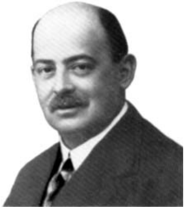
Figure 8: René Jeannel.

Ce premier travail de l'œuvre biospéologique d'Emile Racovitza renferme dans ses 118 pages une révision critique très argumentée des observations antérieures et une clairvoyance prégnante sur le développement futur de l'étude complexe du domaine souterrain. L'intention de l'auteur de remplacer ainsi l'ancien amoncellement hétérogène d'opinions contradictoires avec un système organisé, bâti