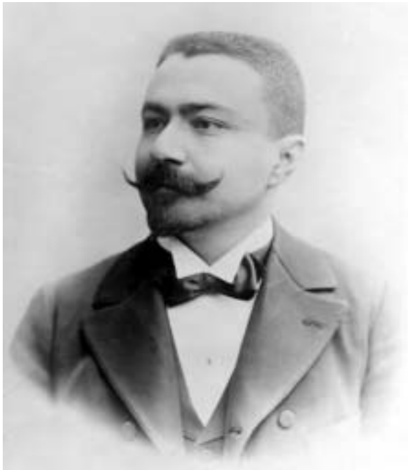
Figure 1: Émile Racovitza en 1899.