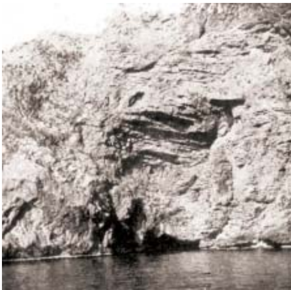
Figure 4: Entrée de la Cova Blava (côte de Catalogne) (juillet 1900).