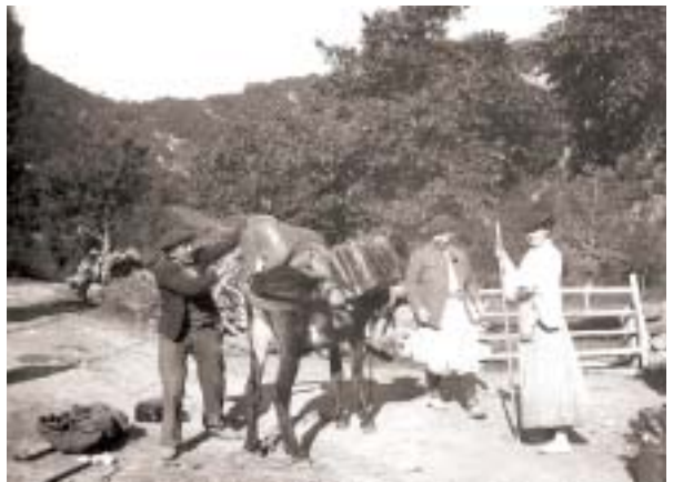
Figure 9: Première campagne biospéologique dans les Pyrénées Centrales. La caravane de mulets sur la Trame Zaïgues (photo E. Racovitza, 9 août 1905).

sur les rigueurs de la méthode scientifique, est dévoilée dans ces lignes finales, en dépit du fait qu'elles portent l'empreinte d'une évidente modestie: „J'arrête ici l'exposé des questions qui doivent être étudiées et des problèmes qui doivent être résolus pour qu'on puisse établir la Biospéologie sur des bases scientifiques. Pour m'exprimer clairement, et pour être court, j'ai présenté la plupart de ces questions et problèmes comme s'ils avaient déjà été résolus. Il règne donc dans cette rapide enquête un ton affirmatif qui serait déplacé s'il n'était autre chose qu'un artifice pour faciliter mon exposé” (RACOVITZA, 1907, p. 484).