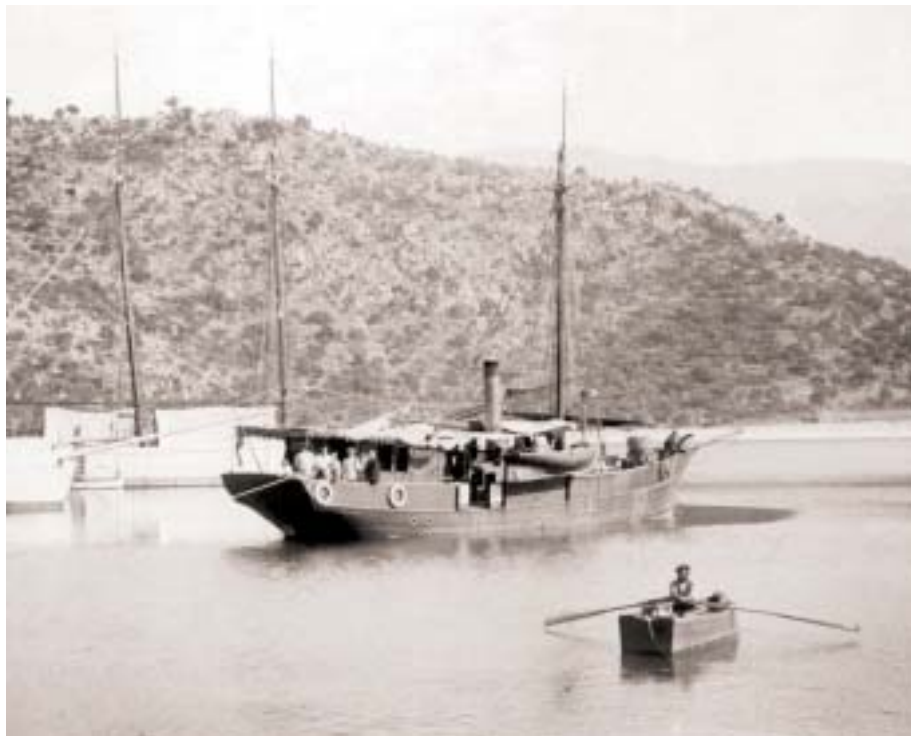
Figura 2: El vaixell “Roland” del Laboratori “Arago” de Banyuls de la Marenda.