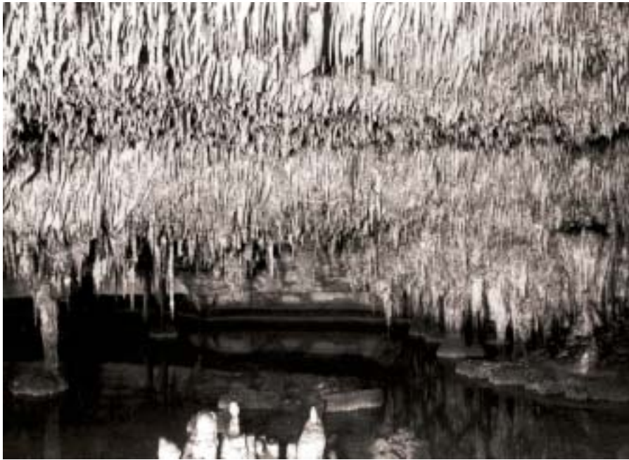
Figure 7: Coves del Drac. Lac des Délices. (photo E. Racovitza, juillet 1904).