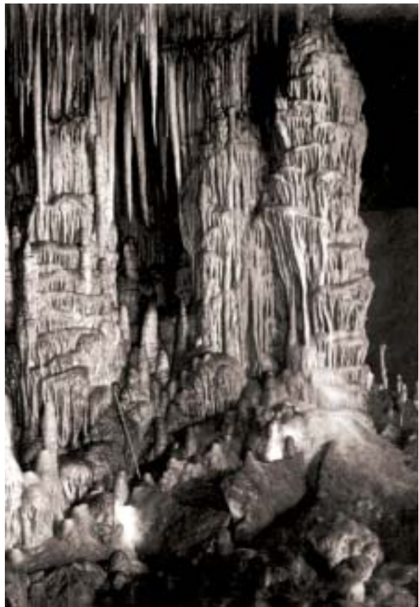
Figure 5: Coves del Drac. Colonnes stalagmitiques dans le Dôme Moragues.

La longue série d'explorations souterraines qui seront entreprises afin d'accumuler les faits sur lesquels devraient se fonder plus tard les conclusions généralisatrices a commencé le 30 juillet 1905, par une campagne qui a duré plus