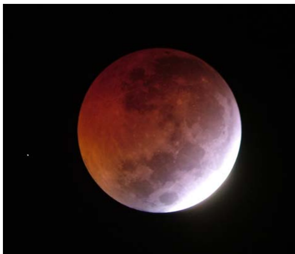
Eclipsi total de Lluna.