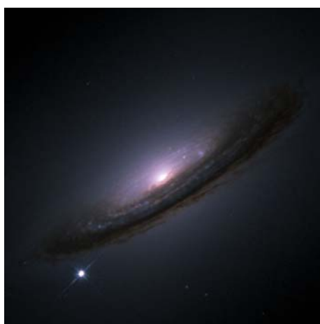
Supernova SN1994D a la galàxia NGC 4526.

Les supernoves són els fenòmens més violents de l'Univers si s'exceptuen les erupcions gamma. Poden tenir dos orígens: el col·lapse del nucli central d'una estrella massiva i la formació d'una estrella de neutrons o bé l'explosió termonuclear d'una estrella nana blanca que forma part d'un sistema estel·lar doble. En tots dos casos les erupcions són imprevisibles i demanen una vigilància intensiva del cel per detectar-los com més aviat millor. L'obtenció de la corba de llum (variació de la lluminositat en funció del temps) és fonamental per comprendre els mecanismes que hi ha darrera l'explosió. Cal senyalar que les supernoves (les de tipus Ia) es fan servir per calcular les distàncies de les galàxies més remotes i han permès determinar que l'Univers s'expansiona de manera accelerada. El problema és que encara no se sap com exploten. Un descobriment precoç i un seguiment exhaustiu són el millor per aclarir aquests problemes. Per això calen telescopis molt accessibles i amb molt de temps disponible.